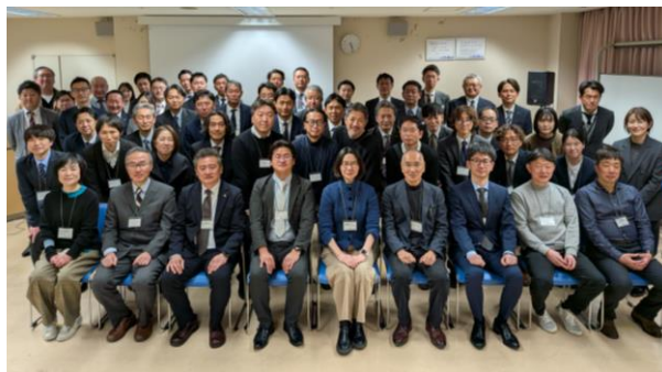
（富田先生と参加者との集合写真）